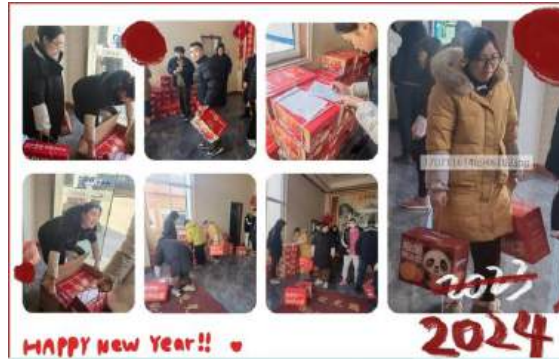
（公司为员工发放春节福利）