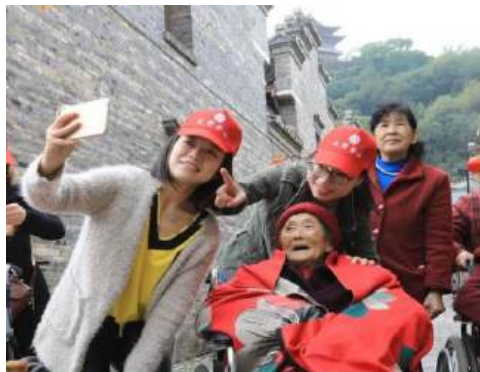
（员工志愿者陪百岁老人游西津渡）