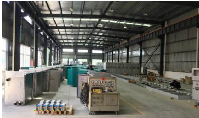
（推行精益生产，提升能源使用效率）