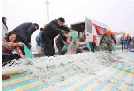
（参加长江放流增值活动，为生态长江做贡献）

公司坚持以“创新引领、责任同行”为社会责任理念，致力于实现公司的经济效益与社会效益相统一，公司的发展和社会的发展相和谐。