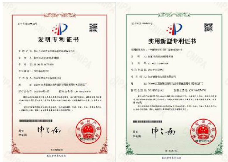
(公司获得发明和实用新型专利证书)