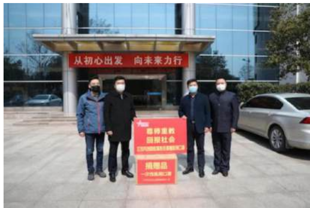
（疫情期间向教育系统捐赠物质）

● 帮助弱势群体： 近10年来，公司向镇德各级慈善机构和困难群体捐款近20万元。