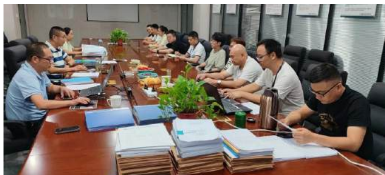
（公司质量、环境、职业健康安全管理体系第三方认证审核会议现场）