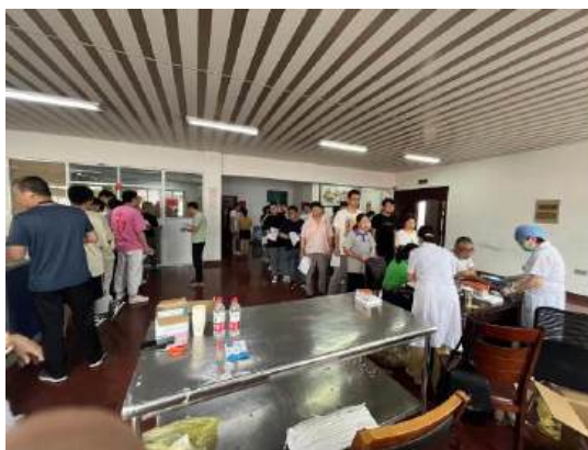
（公司全员免费体检）