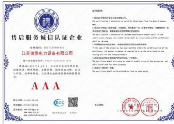
(公司为 AAA 级售后服务诚信认证企业)