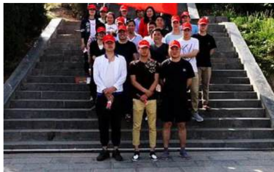
（举行登山活动，欢庆五四青年节）