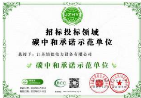
(招标投标领域碳中和承诺示范单位)