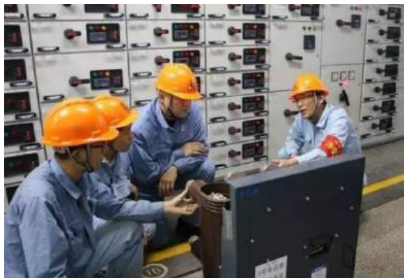
（施工现场“师傅带徒弟”）