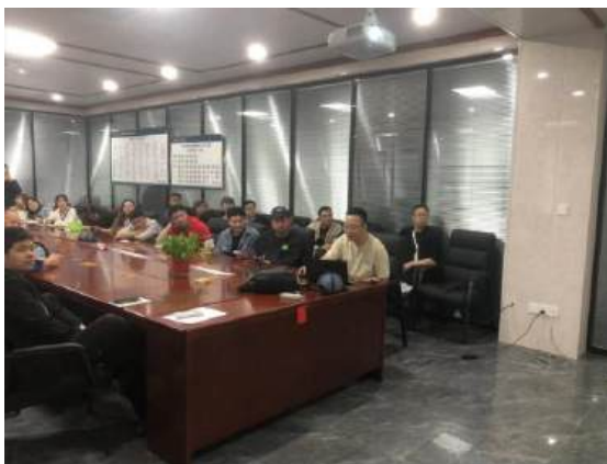
（员工产品质量知识培训）