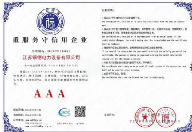
(公司为 AAA 级重服务守信用企业)