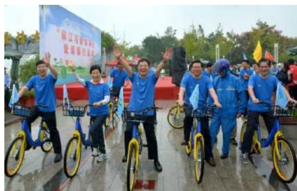
（参加镇江市低碳骑行活动，倡导低碳生活）