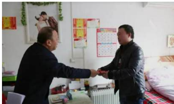
（公司领导慰问困难员工）