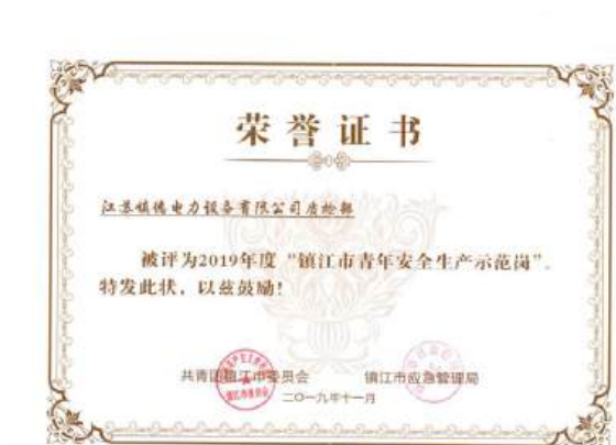
（公司质检部获得“镇江市青年安全生产示范岗”）