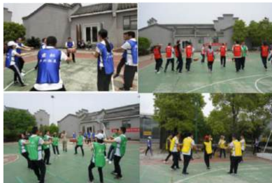
（户外拓展活动现场）