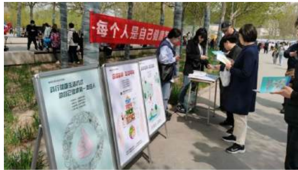
（员工走上街道宣传环保知识）