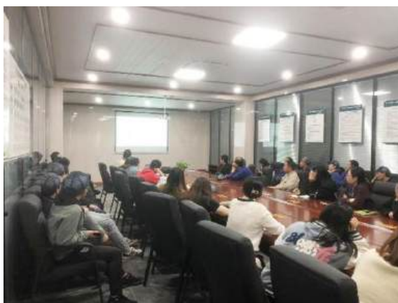
（公司全体管理人员参加质量、环境、职业健康安全管理体系知识培训）

● 其他： 推动公司内部人才交流：安排优秀管理干部、业务骨干或专业技术人员到其他公司交流学习，促进公司内部知识、技能和经验的传承，培养全面综合的人才，为公司长效可持续发展服务。