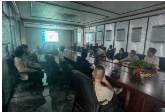
（员工在进行安全生产培训）